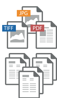
Různé druhy dokumentů

Prostřednictvím své evropské sítě partnerů s FlexiCapture certifikací nabízí ABBYY bezproblémovou a hladkou integraci s rozličnými ERP systémy, jako je SAP, Oracle nebo Microsoft, do workflow/BPM a ECM řešení.